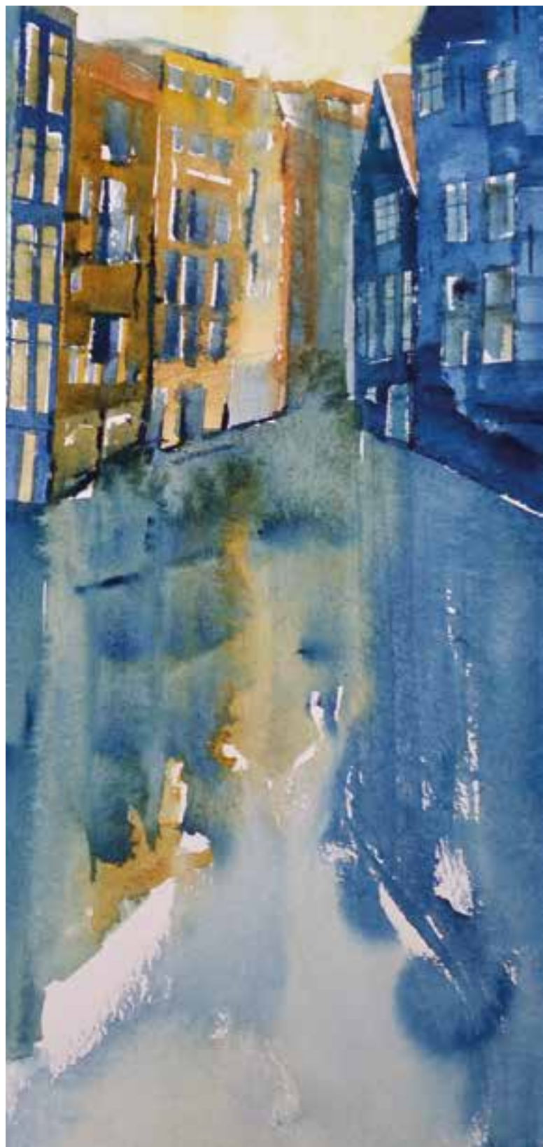
Peinture aquarelle de l'artiste local Wim Tromp.

obtenue est assez grande pour être devenue la 12e province des Pays-Bas : le Flevoland.